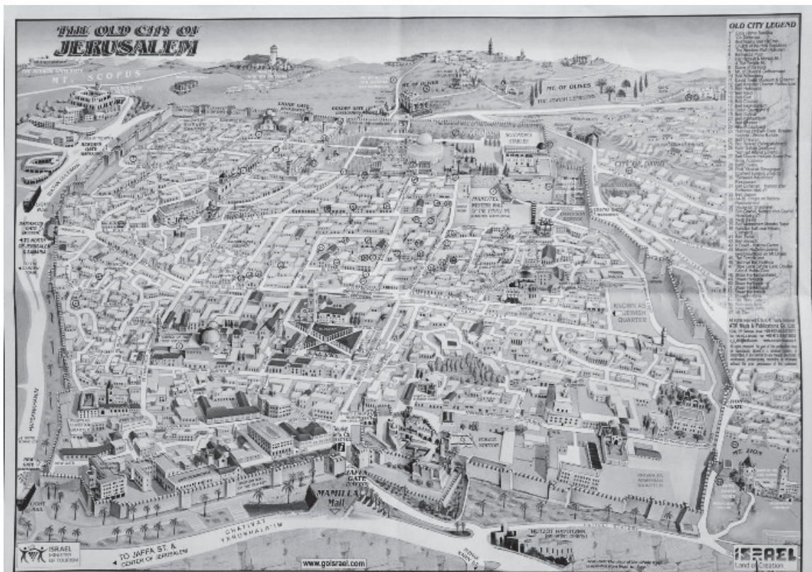
図5 イスラエル観光省が作成したエルサレム旧市街の絵地図

る場所として整備するために、多額の資金を投入しています。そこには、ビジターセンターの建設も含まれていますが、実際にはそれは観光客のためというよりも、シルワーンに住み始めた入植者のための施設となっています。このように、一見すると非常に実務的・官僚的に見える、都市の観光資源開発が、いかに政治的であるかが分かります。また、もう一つエルサレムの開発プロジェクトの中には、西エルサレムと旧市街を繋ぐモノレールの建設もありました。このプロジェクトの目的は、西側から旧市街へ、ユダヤ人が安全に移動できるルートを作ることでした。しかし、この巨