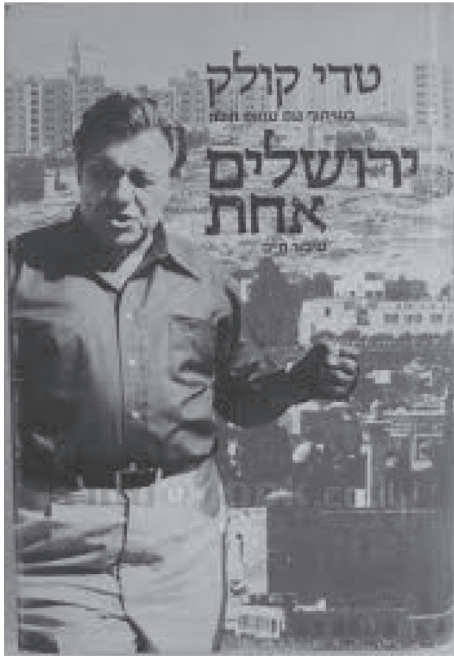
図2 元エルサレム市長テディ・コレクの著作。コレク自身が写っている。

エルサレムをイスラエルの新たな首都の一部にしたいのであれば、とにかく建設、建設、建設であり、住宅、道路、インフラ、公共建築、新しい景観などを作り続ける必要がある、ということでした。つまり、建築、都市計画、開発が、エルサレムを統一された都市にしていくうえで、いかに重要かを、彼は非常に早い段階で認識していたのです。その背景には、ダヴィド・ベン＝グリオンの発言とも重なる考え方がありました。それは、いかなる犠牲を払ってでも、ユダヤ人を東エルサレムに移住させなければならない、というものです。何千人ものユダヤ人が、できるだけ早く入植すべきだ、と。ユダヤ人は、掘っ立て小屋であっても東エルサレムに住むことに同意するだろ