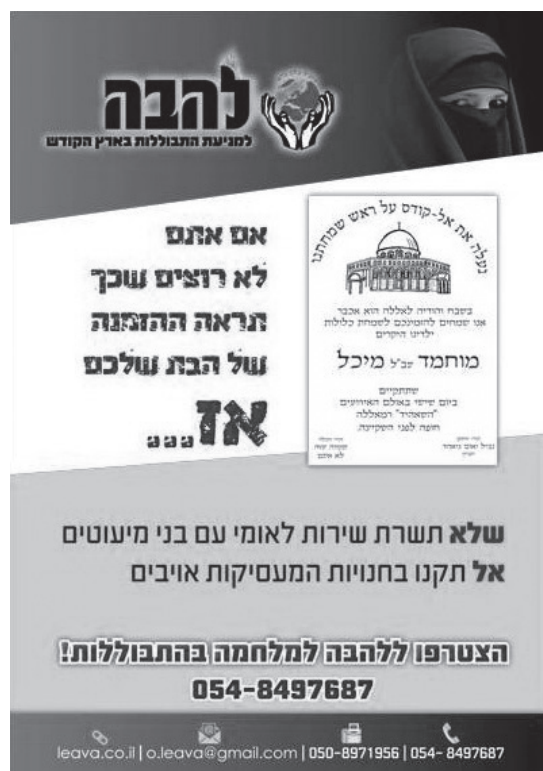
図4 アラブ人排斥を求める極右団体レハヴァによる排外主義的なチラシ。

1967年に占領されたエルサレム旧市街について、イスラエル観光省が作成した地図です。旧市街は、エルサレムで最も美しい空間の一つです。ここでは詳しく立ち入りませんが、この地図には、旧市街にあるムスリムの聖地についての記述が一切ありません。この地図を使う観光客にとって、エルサレム旧市街は、ユダヤ教とキリスト教の土地でしかなく、ムスリムもパレスチナ人も存在しない空間として提示されています。また同時に、こうした記述の形成には、非常に大きな政治的圧力がかかっています。たとえば、観光省は、シルワーンの考古学遺跡を、ユダヤ的な語りのみを提示す