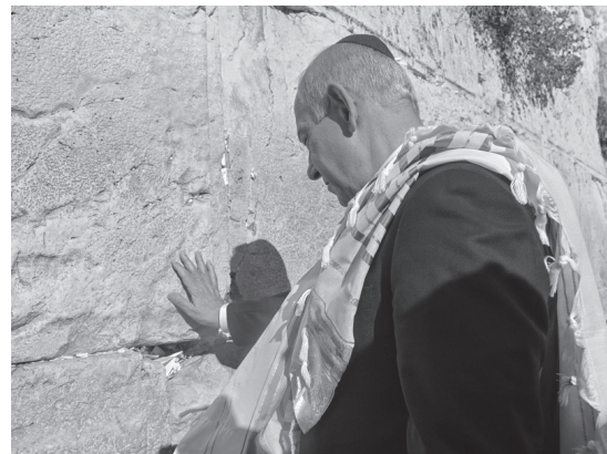
図1 エルサレム旧市街の嘆きの壁を訪問するベンヤミン・ネタニヤフの様子