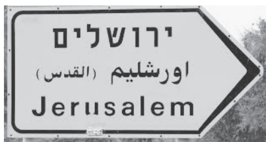
図6 ヘブライ語とアラビア語双方でエルサレム市の方向を表す標識

アパートヘイト的都市というパラダイムへと進む道を選択しています。その一例として、ユダヤ人用とパレスチナ人用に分けられた道路があります。これは、きわめて典型的なネオ・アパートヘイトの装置です。次に示した道路標識はエルサレムを示したのですが、私はこの標識がとても好きです。ヘブライ語で「イエルシャライム (ירושלים)」、アラビア語で「アル＝クドゥス (القدس)」と書かれています。というのも、結局のところ、エルサレムは実践のレベルでは、すでに共有された都市だからです。平等な条件ではありませんが、それでも、イスラエル人とパレスチナ人が共存する潜在性を持っています。ここでパレスチナ側の呼称の問題にはあまり深く立ち入りませんが、この言語の問題自体にも、非常に強い政治性があります。パレスチナ人は普段、エルサレムを「アル＝クドゥス」、つまり「聖域」と普段読んでいますが、イスラエル側は、アラビア語で表記する際にも、ヘブライ語の「イエルシャライム」に近い「ウルシャリーム (أورشليم)」という表記を用いています。ただ、ここから理解できるのは、明確な解決策が存在し、それには強い政治的意思と、地域全体における戦略的な変化が必要になります。そして私は、エルサレムこそが、イスラエル／パレスチナにおいて、どのように共有空間を構築しうるのかを示す、先駆的な事例として理解されるべきだと考えています。